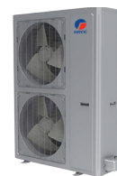
Condenseur 60 000 BTU/h