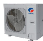
Condenseur 36 000 BTU/h