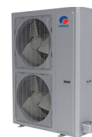
Condenseur 60 000 BTU/h