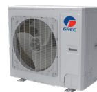
Condenseur 36 000 BTU/h