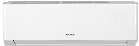
Unité murale Extreme