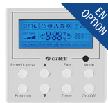
Thermostat filaire (XE-71)